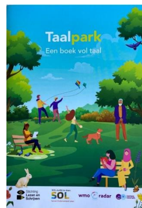
Het oefenschriftje 'Taalpark'

In de Huizen van de Wijk, bibliotheken en via op verschillende CJG-locaties (Centrum voor Jeugd en Gezin Rijnmond) werd het speciaal voor deze week uitgebrachte oefenschriftje Taalpark verspreid.